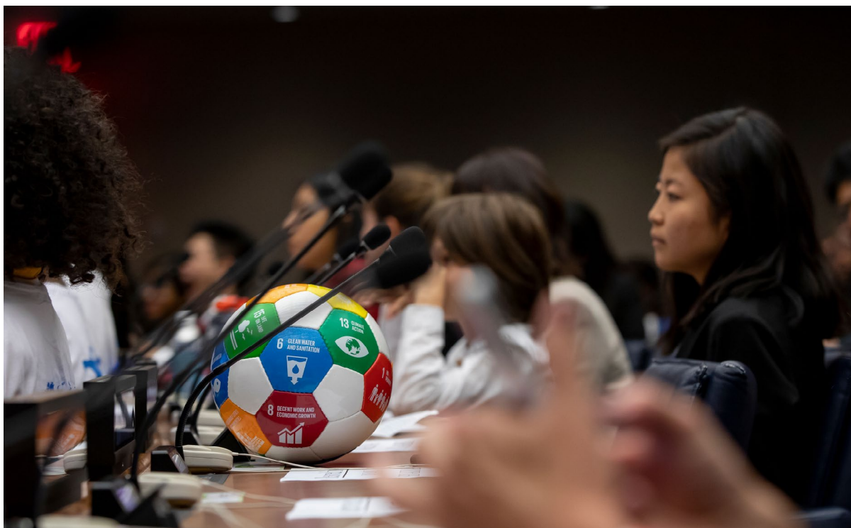
Asistentes a la celebración estudiantil del Día Internacional de la Paz (21 de septiembre).

El deporte puede servir para tender puentes entre comunidades, sean cuales sean sus diferencias culturales o divisiones políticas, ya que no entiende de fronteras geográficas, diferencias étnicas ni clases sociales. También es importante para promover la integración social y el empoderamiento económico. El deporte puede ayudar a los jóvenes en situación de riesgo (incluidos los desempleados y los migrantes), porque se estructura en torno a normas, conductas y reglas que también resultan beneficiosas para la comunidad en general, y puede ser un medio muy eficaz de empoderar a las mujeres y fomentar la igualdad de género.