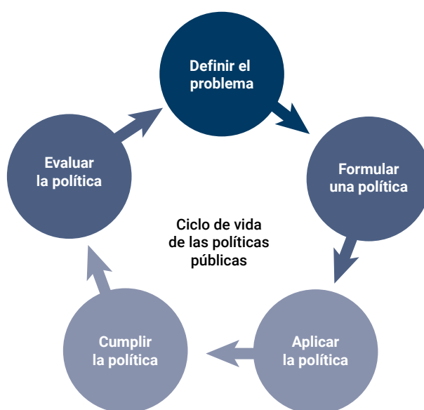
Figura 3 Formulación de políticas y ciclo de vida de las políticas públicas