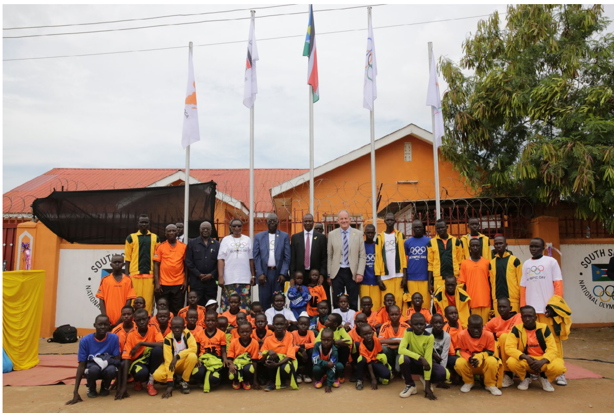
Ceremonia celebrada con ocasión del reconocimiento del Comité Olímpico de Sudán del Sur por el Comité Olímpico Internacional.

rollo en relación con los grandes eventos deportivos. El Comité Olímpico Internacional desempeña un papel esencial, porque define las prioridades en lo que respecta a la credibilidad, la sostenibilidad y la juventud para todo el deporte olímpico. Por la posición que ocupa, es un importante aliado para decidir cómo se utilizará el deporte en las iniciativas de desarrollo nacionales e internacionales y cómo se maximizarán sus efectos positivos en las esferas social, económica y ambiental.